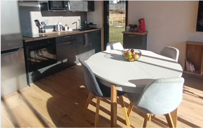
Séjour-cuisine du chalet, spacieux et lumineux.