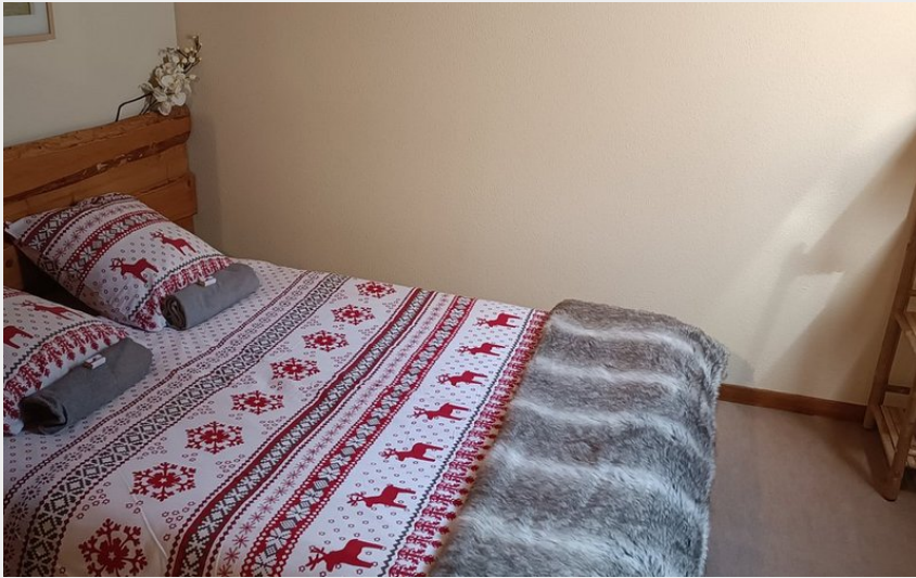
Crédit photo : Chambre Auberge - refuge de Roybon (Christelle et Emmanuel Goujon)