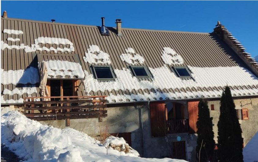
Crédit : Les violettes du Grand Veymont_Gresse-en-Vercors (Gîtes de France)