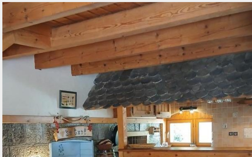
La Fruitière - Gîte 8 personnes_Gresse-en-Vercors