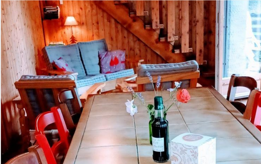
Crédit : La Fruitière - Gîte 6 personnes_Gresse-en-Vercors (Gîtes de France Isère)