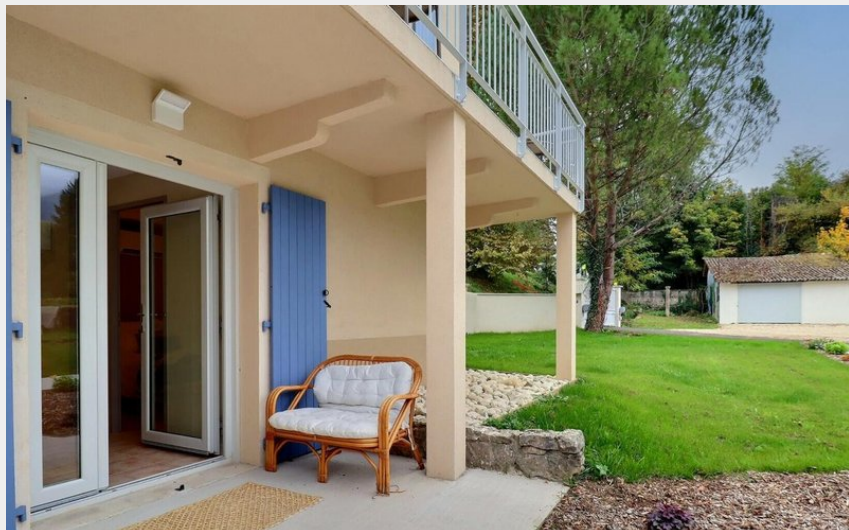
L'entrée du gîte et sa terrasse privative, partiellement abritée