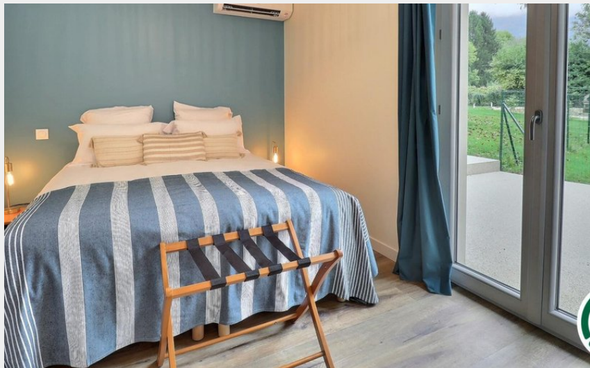
Chambre AURORE : un lit double (1x160), accès direct à la terrasse privative