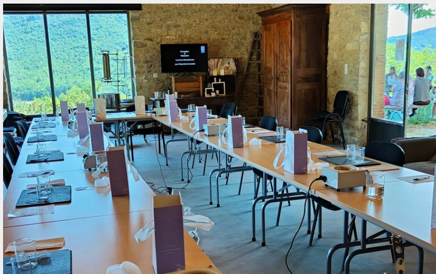
Crédit : Atelier de fabrication de cosmétiques Bio. L'essentiel de lavande._La Bégude-de-Mazenc