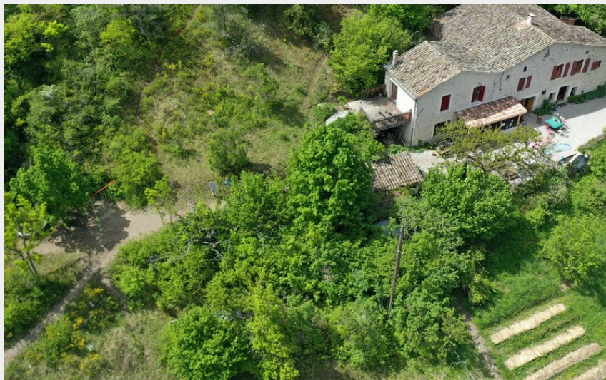
Crédit : vue générale