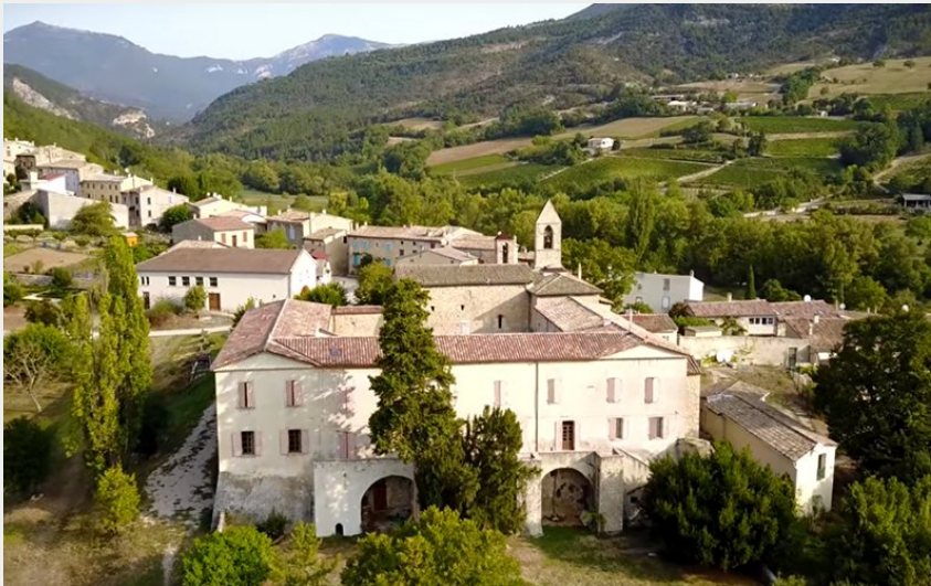
Crédit : Hébergement collectif - Monastère de Ste Croix (SCIC NOUVEAU MONASTERE)