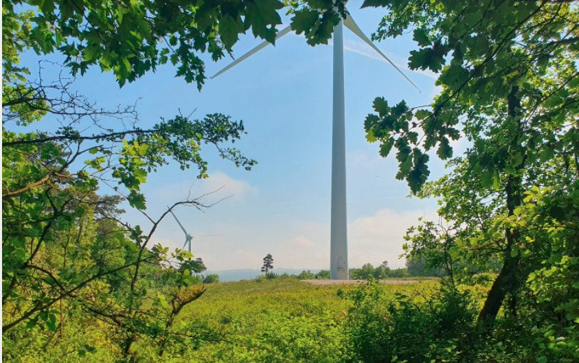
Crédit : Sous les éoliennes_La Roche-sur-Grane (Sous les éoliennes_La Roche-sur-Grane)