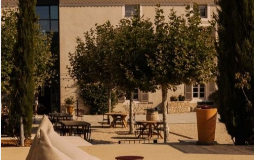
Crédit : Escapade dans les vignes en duo_Livron-sur-Drôme (Garenne)