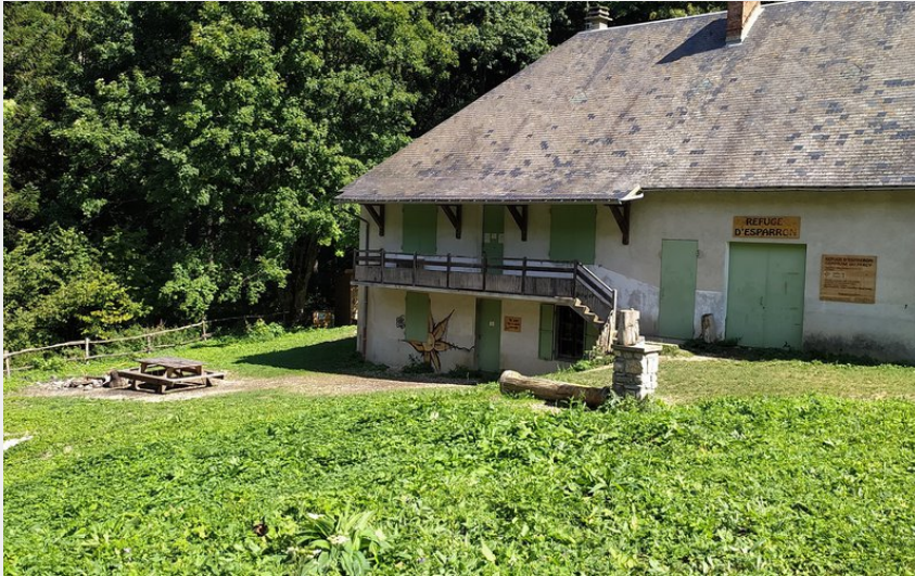
Crédit : devant le refuge