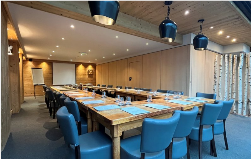
Crédit photo : Salle de séminaire des Clarines (Hôtel des Clarines)