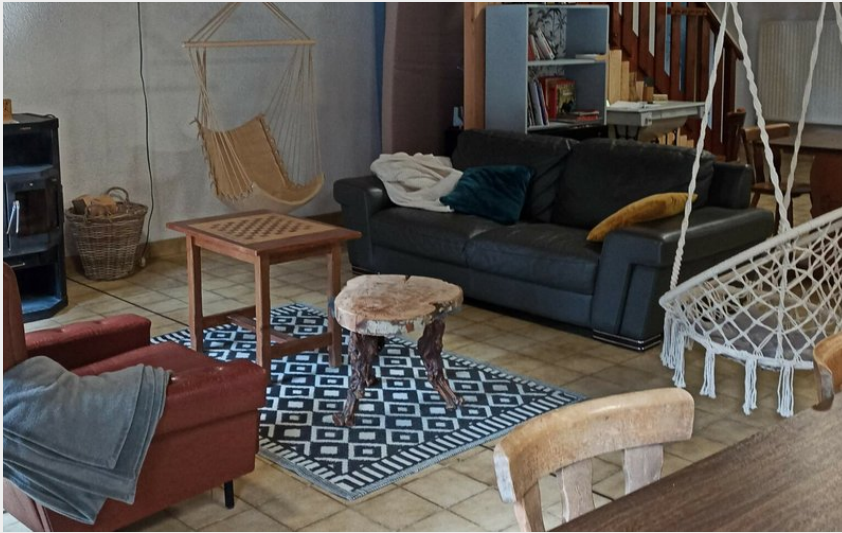
Salon convivial du Gîte et auberge de Carri