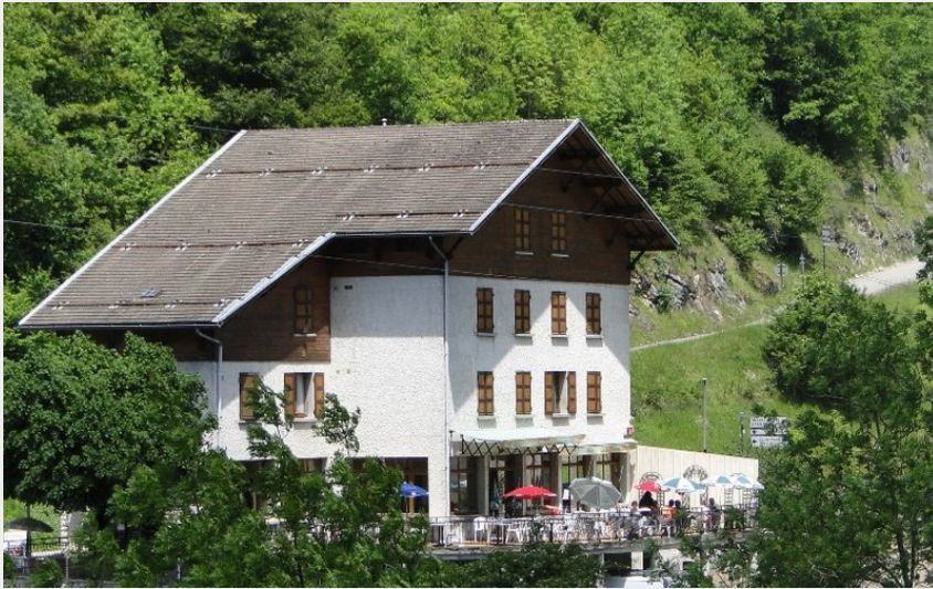
Crédit photo : Hôtel-Restaurant de la Bourne à Rencurel dans le Vercors (Fillet-Coche)