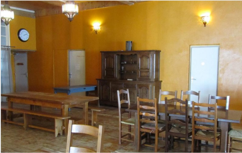
Le séjour avec poêle à bois et salon