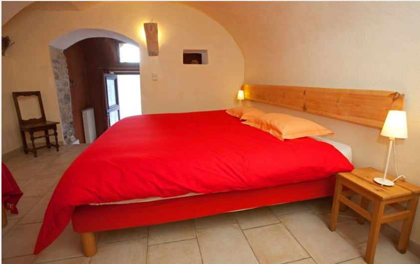
2 chambres sont sous voûtes. Fraîcheur assurée.