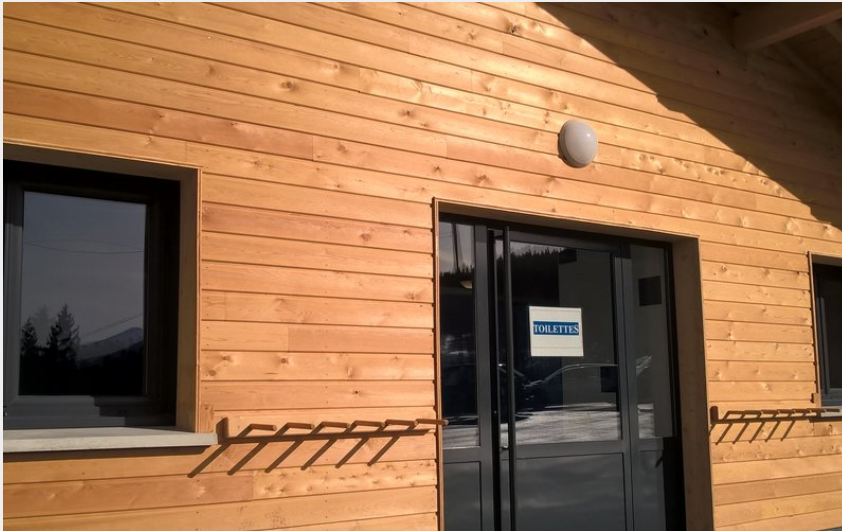
Crédit photo : Aire de service des Montagnes de Lans (OT Lans en Vercors)