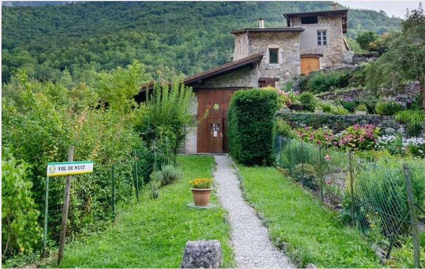
Le Gîte et le bac de Chatelus en arrière plan