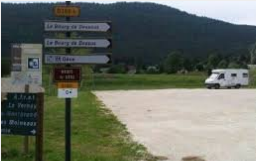
l'aire de stationnement des camping-cars d'Autrans