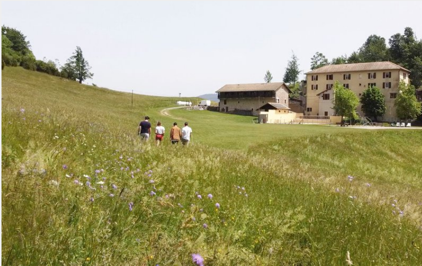
Crédit photo : Vue de l'auberge depuis la prairie (Hostel Quartier Libre - Evan GIRAUD)