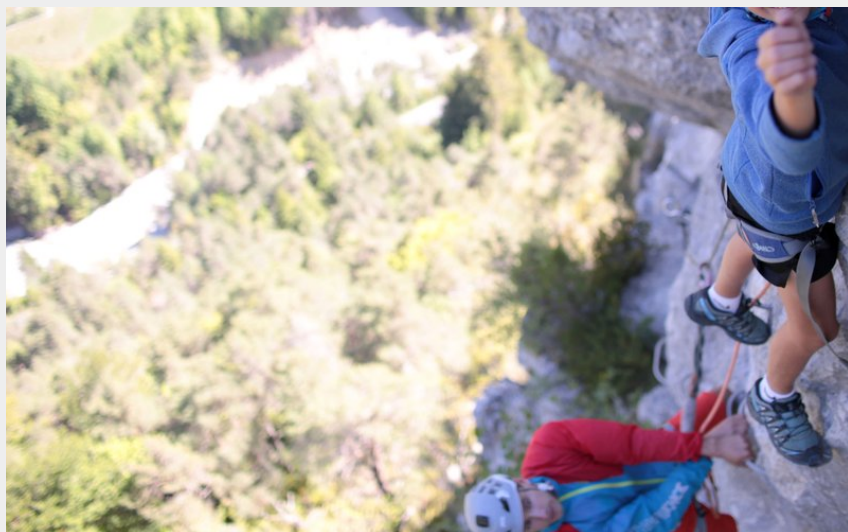
Crédit : Lubin attrape le barreau suivant de la via ferrata (En Montagne)