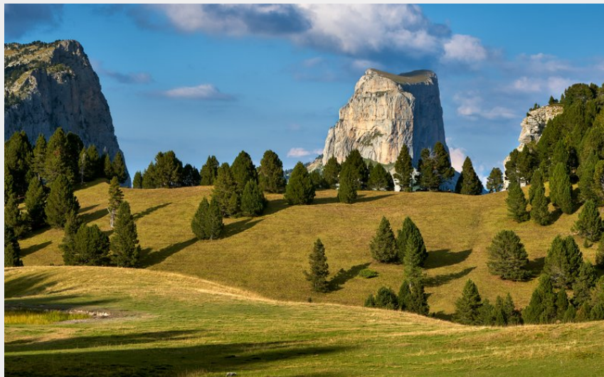
Le Mont Aiguille depuis les hauts-plateaux du Vercors