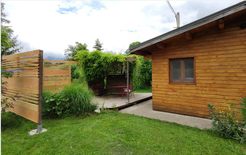
Extérieur et entrée du petit gîte