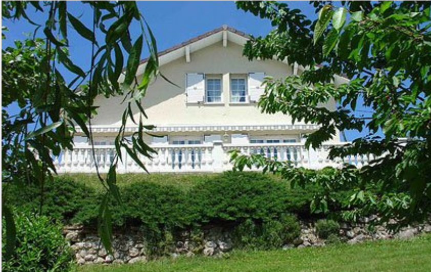
Crédit : La villa, Gîte Les Althéas à La Chapelle en Vercors, avec son parc arboré (C. Carletti)