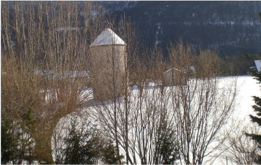
Crédit photo : Vue du gîte l'hiver par temps de neige (Gîtes de France)