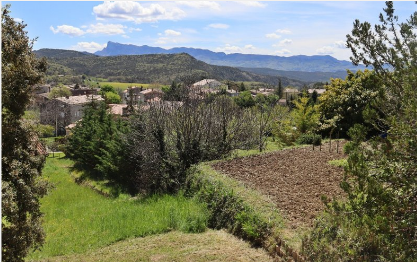
Vue sur la vallée de la Gervanne et les 3 Becs depuis la terrasse.