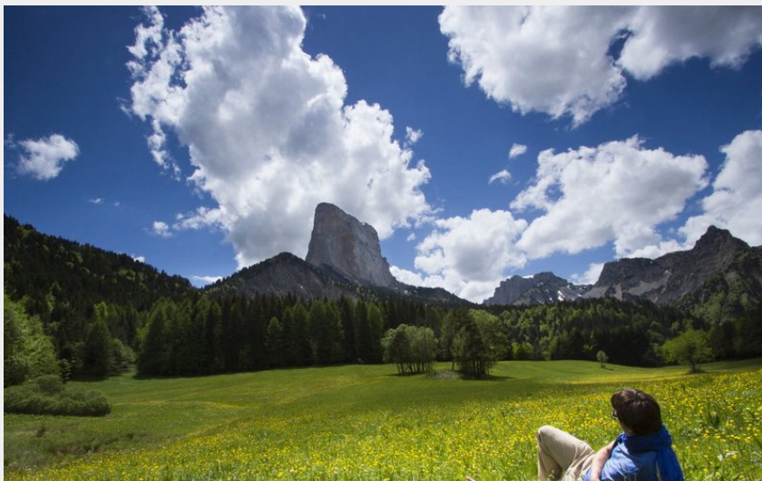
Le Mont Aiguille (S.M Booth)