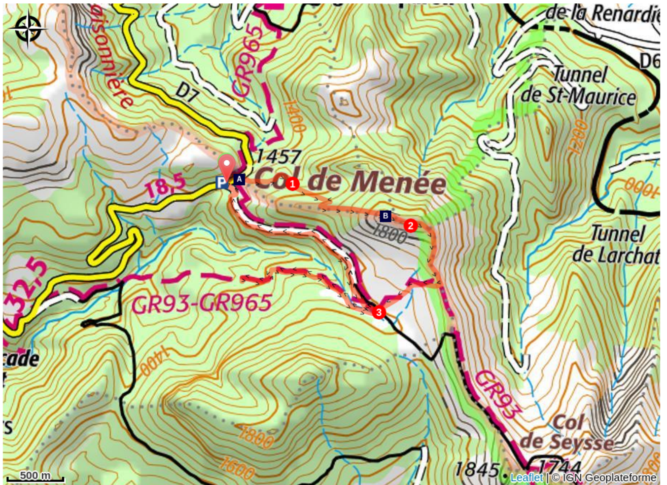
Col de Menée (A)