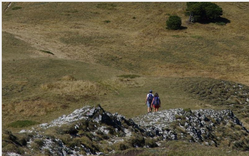
Col de Jiboui