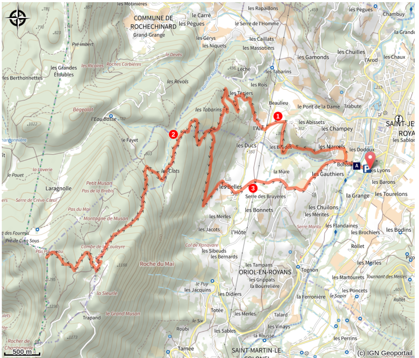
La Lyonne (A)