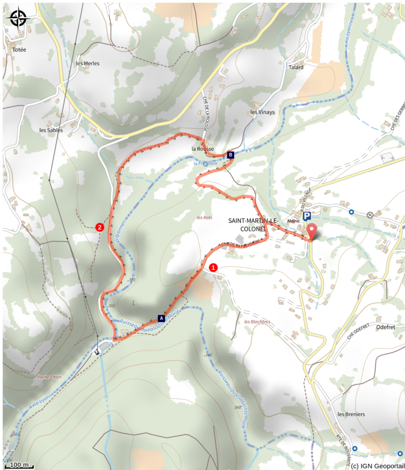
Ruines du château des Flandaines (A)