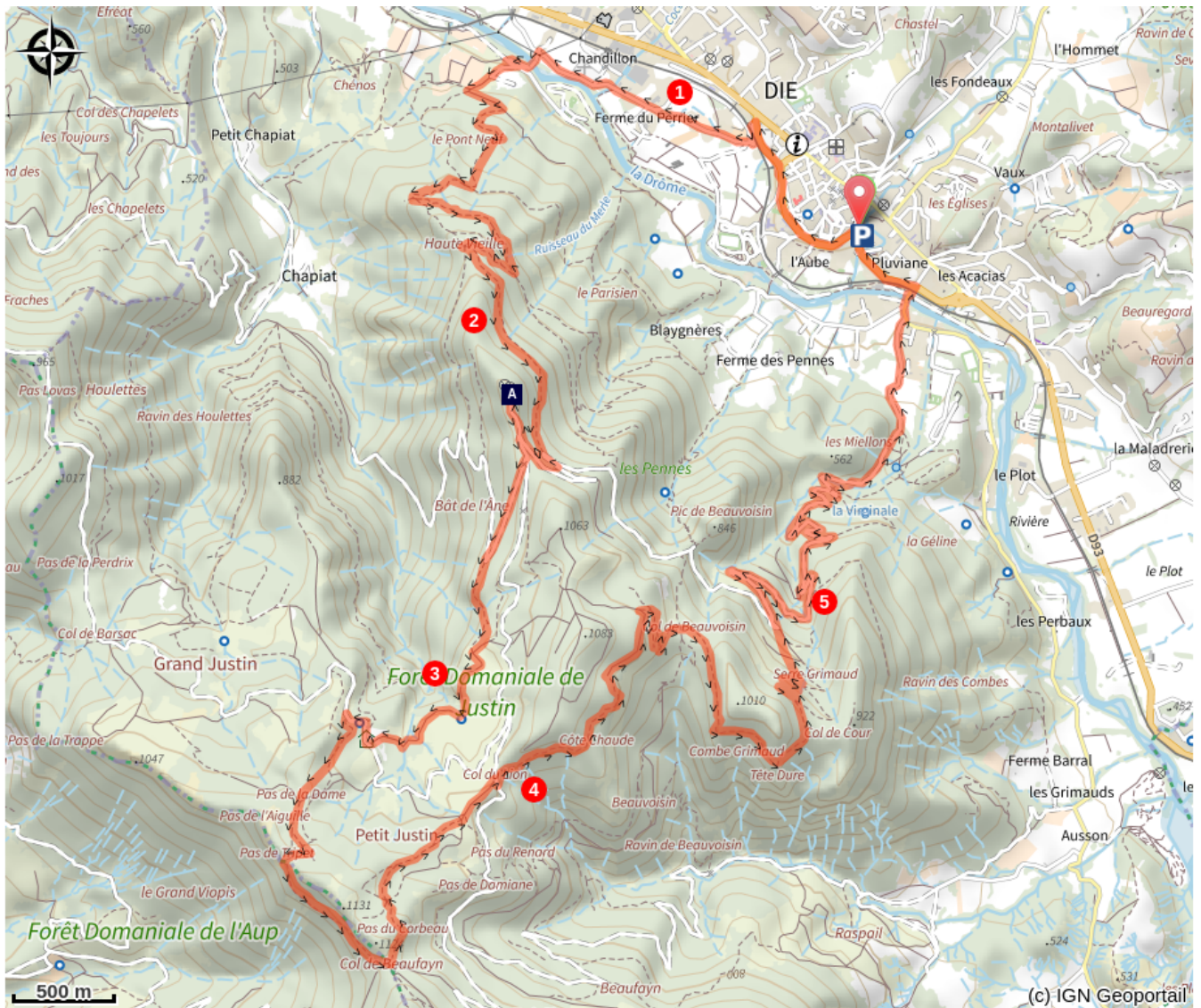
La Croix de Justin (A)