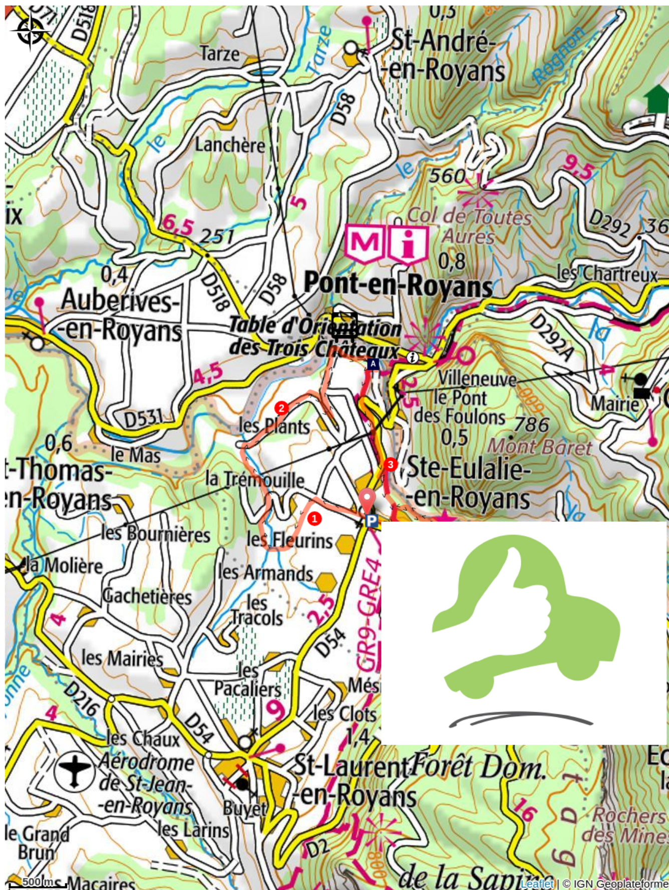
Vue de Pont-en-Royans (A)