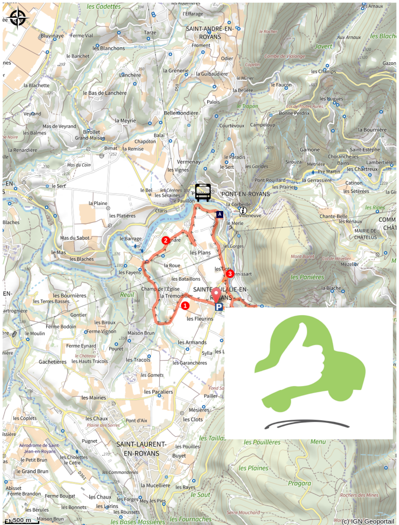
Vue de Pont-en-Royans (A)