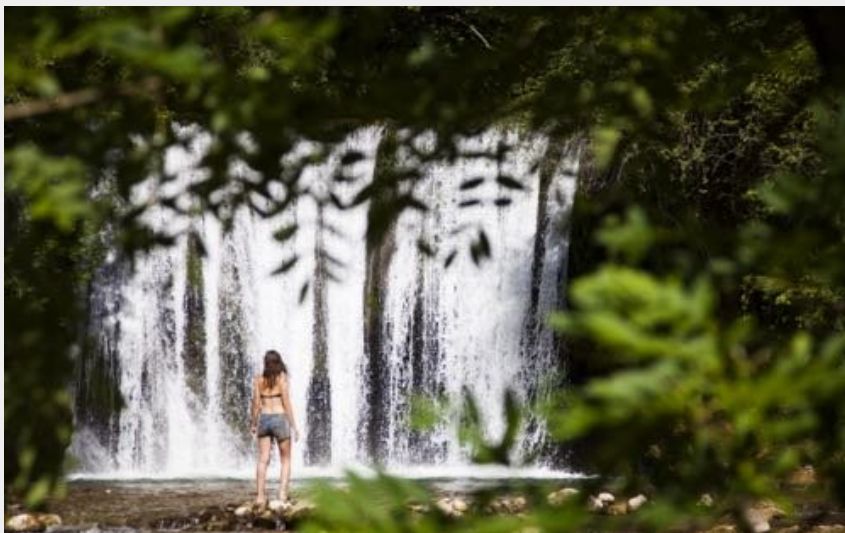
Cascade blanche (S.M Booth)