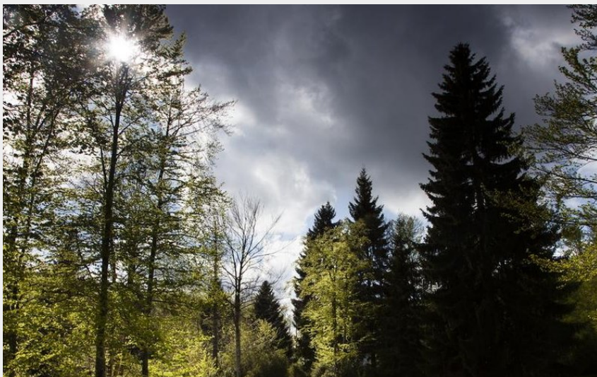
Clairière (S.M Booth)