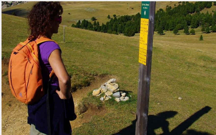
Col de Jiboui