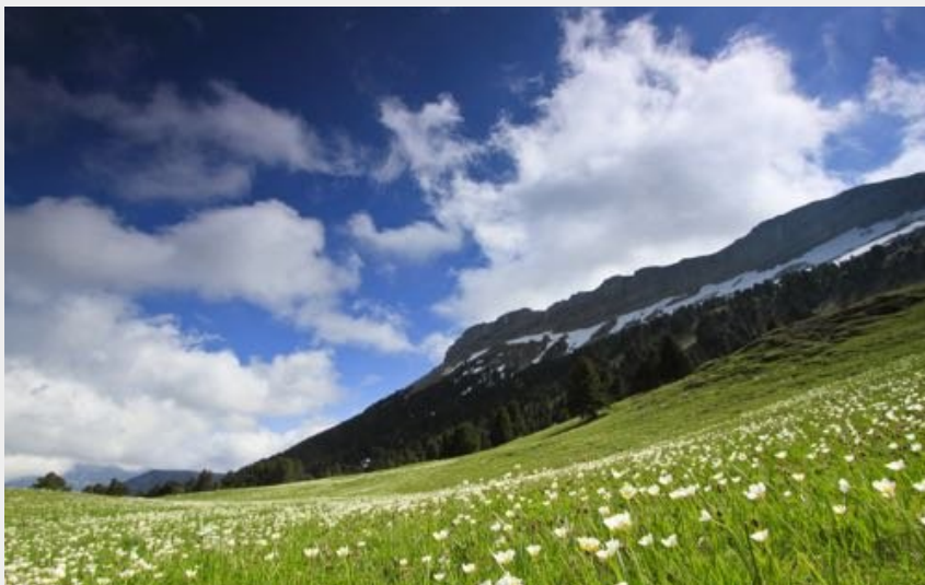
Combeau (S.M Booth)