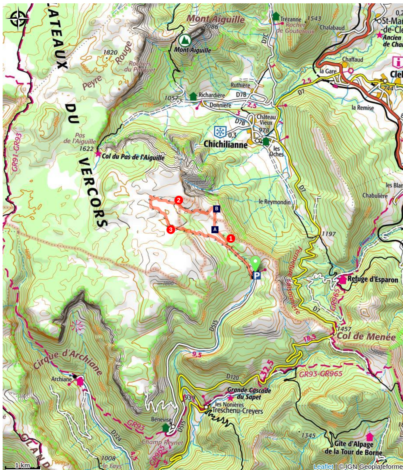
Cabane de l'Essaure (A)