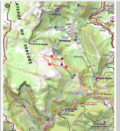
Combeau (S.M Booth)

Rejoignez les Hauts-Plateaux du Vercors en passant par le verdoyant vallon de Combeau et ses alpages. Le dépaysement est assuré !