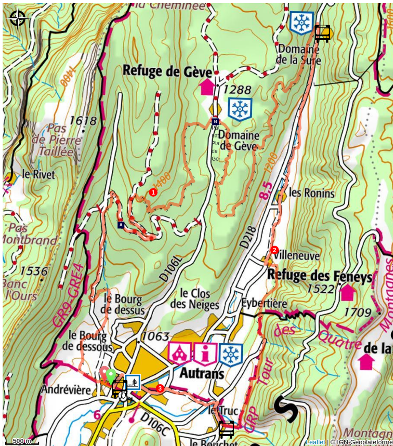
Grotte de la Ture (A)