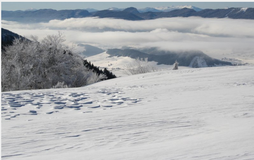
Plateau de la Molière (V.Giry)