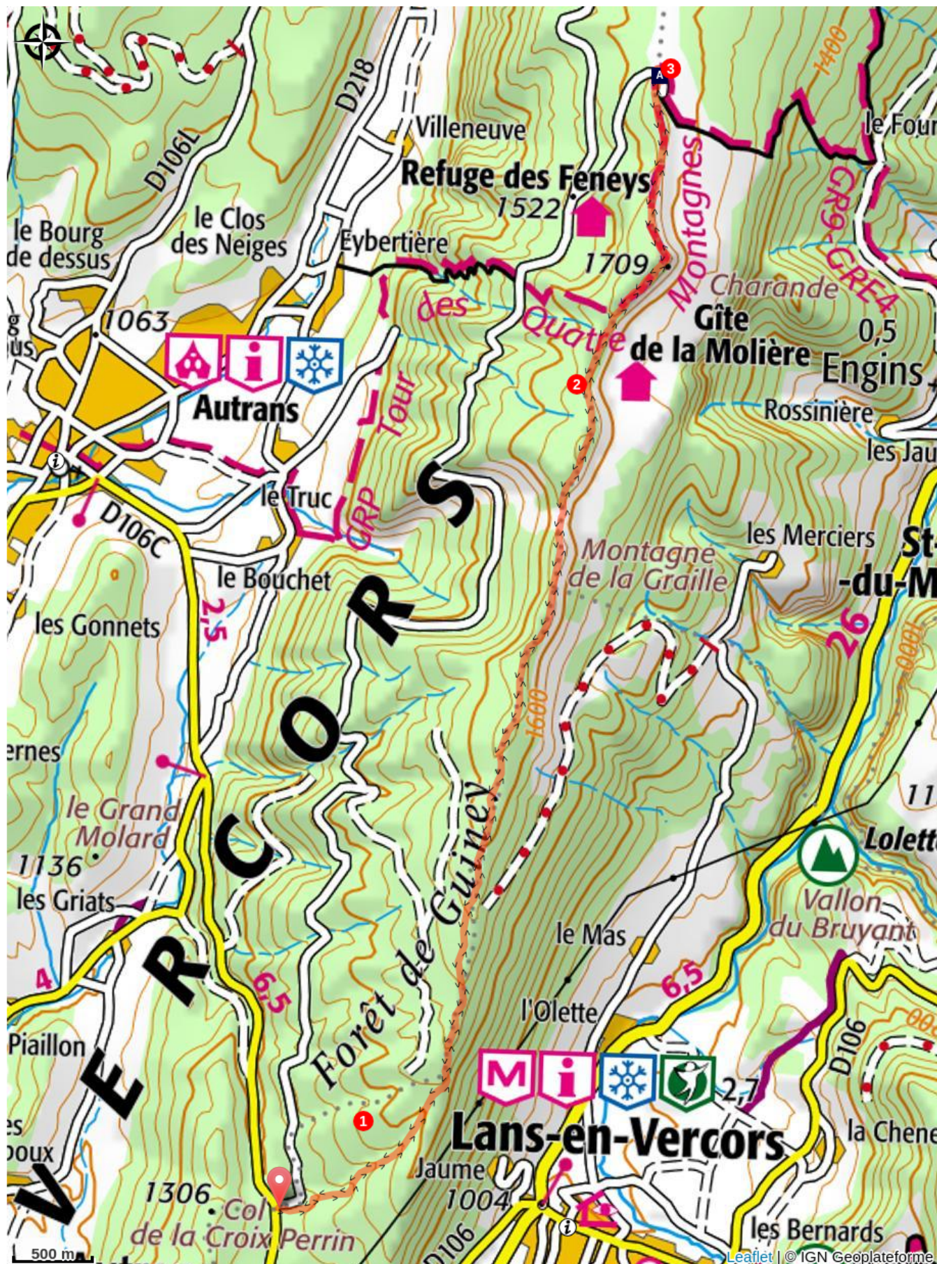
Belvédère de la Molière (A)