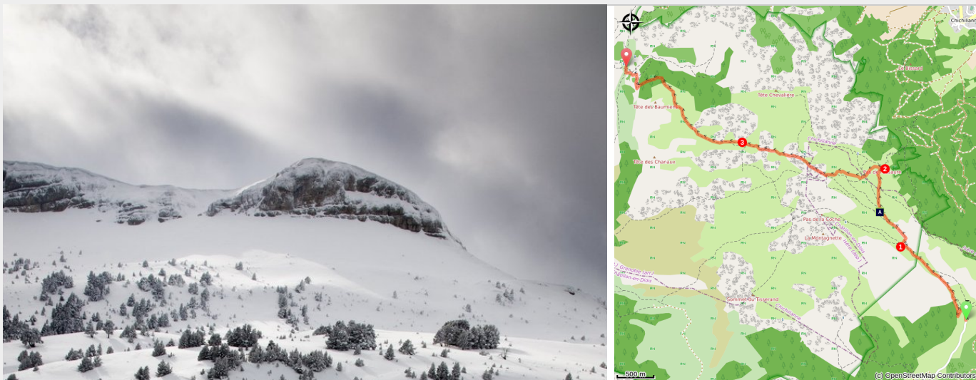
Vers la montagnette (S.M Booth)