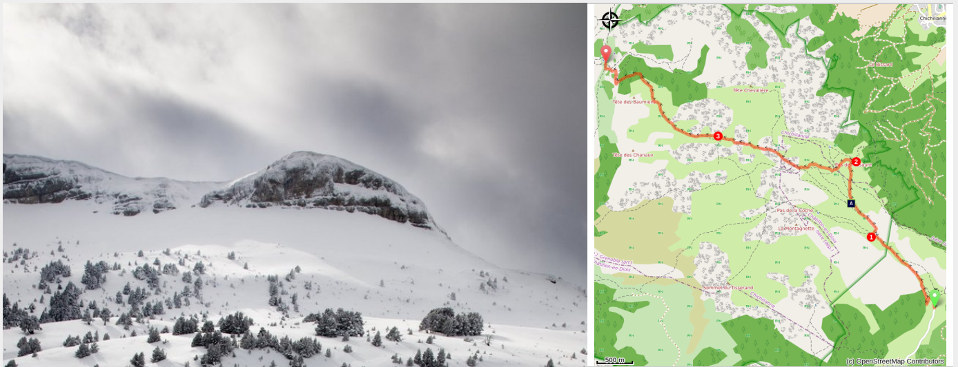
Vers la montagnette (S.M Booth)