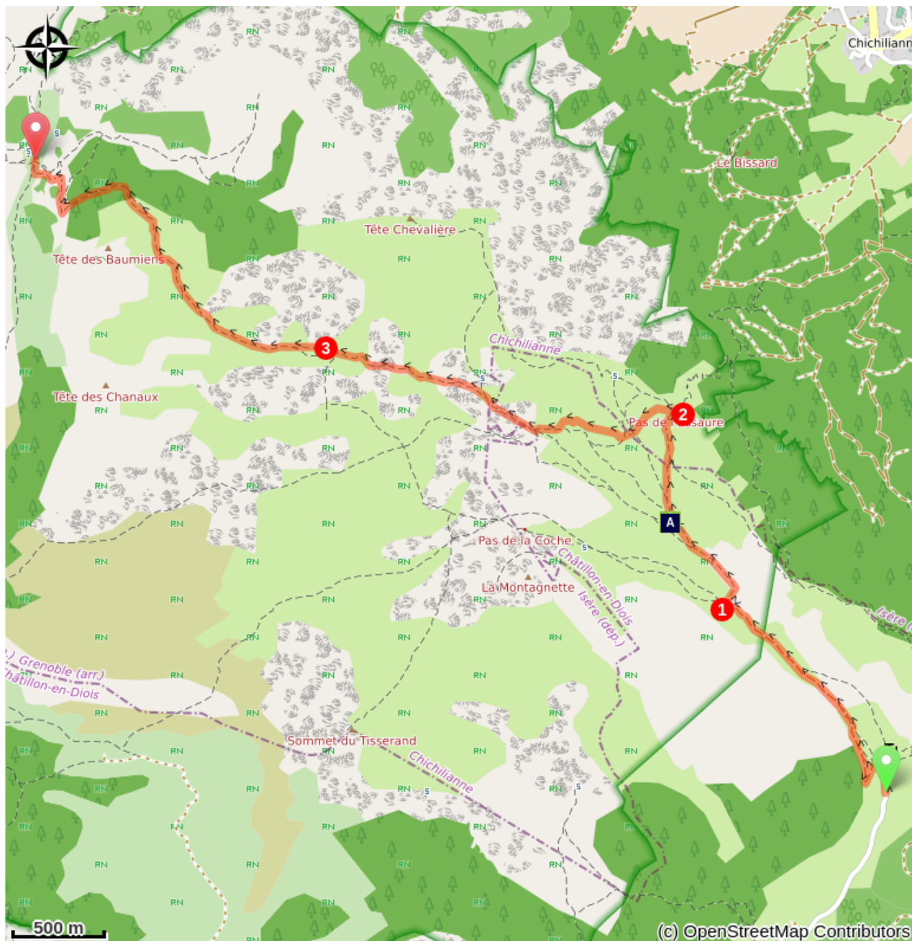
Cabane de l'Essaure (A)