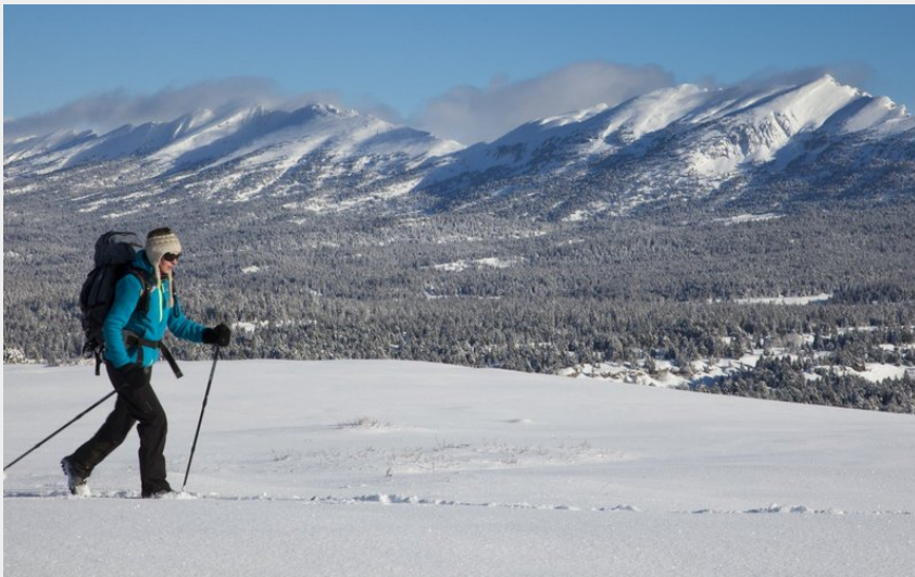
Vue sur la Réserve (S.M Booth)