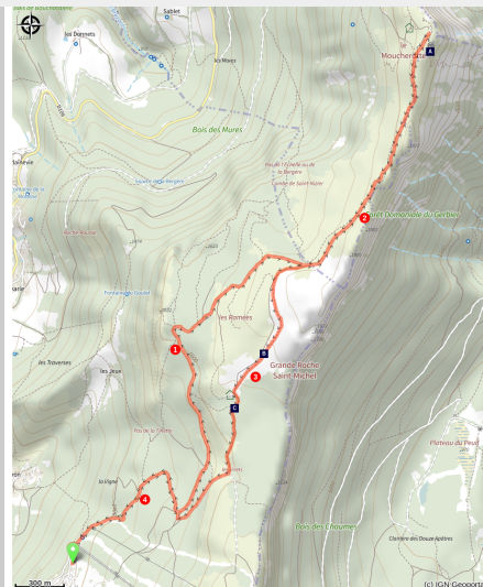
Au sud du Moucherotte (S.M Booth)

Itinéraire emblématique pour les Grenoblois. La vue du Moucherotte est magnifique. Une des plus belles vues sur Grenoble et ses environs.