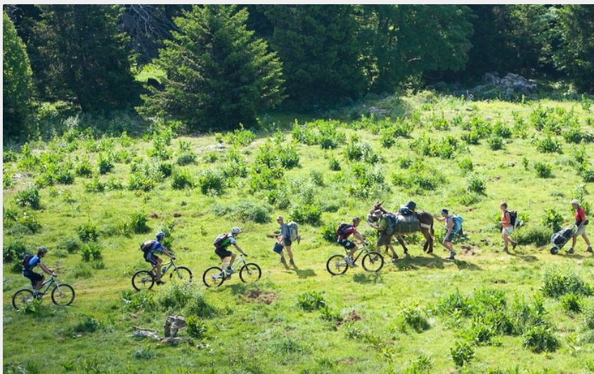
Le Plateau d'Ambel (PNRV)