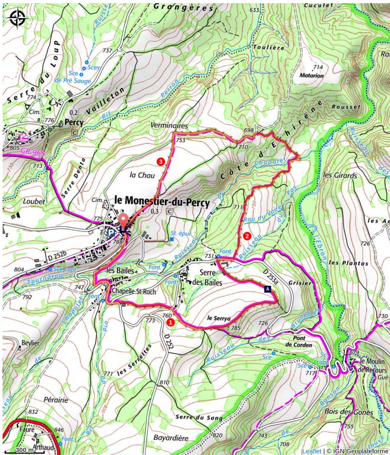
Le Serrya (A)