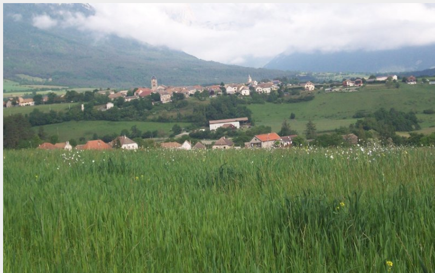
Village de Monestier-du-Percy (Manon Girard)