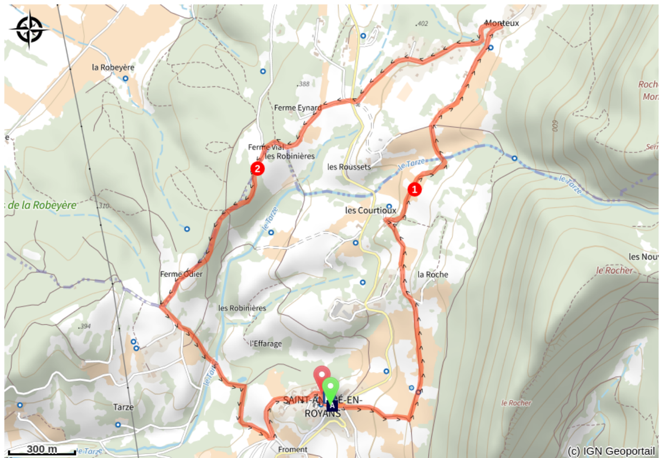
Village de St André-en-Royans (A)