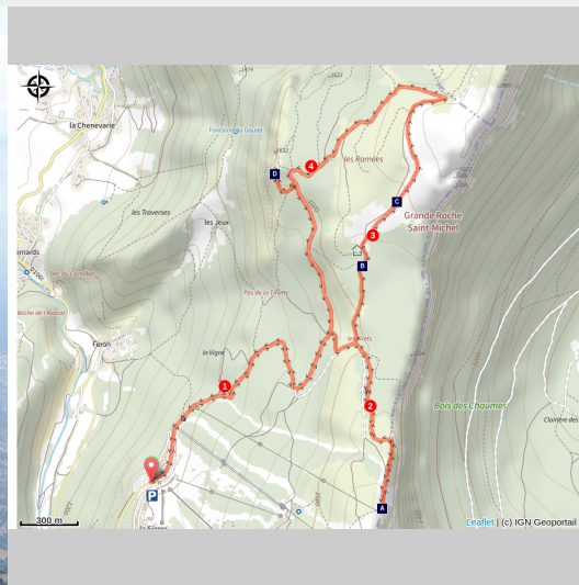
Le Belvédère Vertiges des Cimes (OTI_Lans-en-Vercors)

Sensations garanties au sommet de la randonnée, ou vous pourrez marcher un instant en toute sécurité, quelques 300 mètres au-dessus du vide !